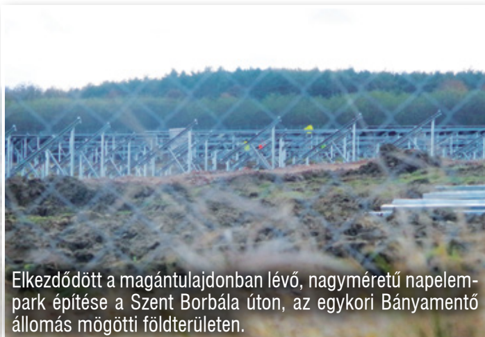
Elkezdődött a magántulajdonban lévő, nagyméretű napelem-park építése a Szent Borbála úton, az egykori Bányamentő állomás mögötti földterületen.