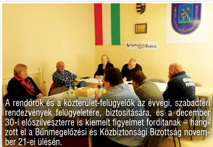
A rendőrök és a közterület-felügyelők az évvégi, szabadtéri rendezvények felügyeletére, biztosítására, és a december 30-i előszilveszterre is kiemelt figyelmet fordítanak – hangzott el a Bűnmegelőzési és Közbiztonsági Bizottság november 21-ei ülésén.