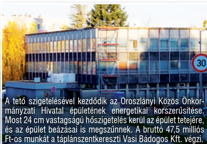
A tető szigetelésével kezdődik az Oroszlányi Közös Önkormányzati Hivatal épületének energetikai korszerűsítése. Most 24 cm vastagságú hőszigetelés kerül az épület tetejére, és az épület beázásai is megszűnnek. A bruttó 47,5 millió Ft-os munkát a táplánszentkereszti Vasi Bádógos Kft. végzi.