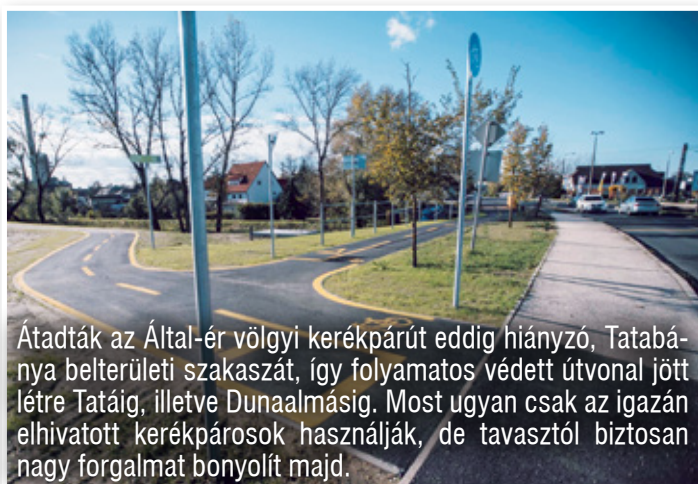
Átadták az Által-ér völgyi kerékpárút eddig hiányzó, Tatabánya belterületi szakaszát, így folyamatos védett útvonal jött létre Tatáig, illetve Dunaalmásig. Most ugyan csak az igazán elhivatott kerékpárosok használják, de tavasztól biztosan nagy forgalmat bonyolít majd.