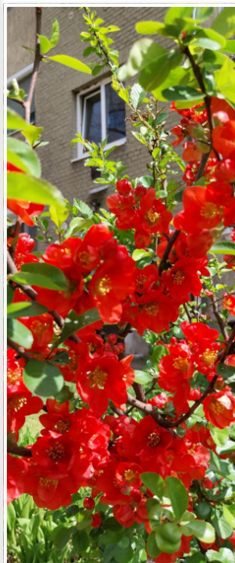
A rovat újabb szereplője: a Tánccsics Mihály utca 16–20.

Korábban is mutattuk már be ilyen, tömbházak melletti beültetett területeket. Most sorozatot indítunk az ilyen példaértékű közösségek bemutatására. A helyszínek az OIH Zrt. facebook oldalán is megjelennek majd. Ha Ön is szeretne hasonló fotót beküldeni, akkor azt a cím megjelölésével az info@oihzrt.hu e-mail címre teheti meg.