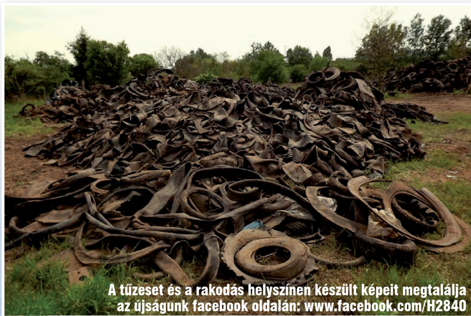
A tüzeset és a rakodás helyszínén készült képeit megtalálja az újságunk facebook oldalán: www.facebook.com/H2840

emelet magas lángokkal tombolt – szerencsére nem lakott területen. Ekkor a több száz tonna, lángoló gumiabroncsot a tűzoltóink is a VÉRT rakodógépeinek bevonásával, folyamatos hűtés mellett, földtakarással tudták leküzdeni. Az oltásban fél tucat tűzoltóautó vett részt, és ne felejtsük el a rakodógép-kezelők helytállásáról sem! A tűz keletkezésének pontos oka nem volt kideríthető, a lerakásért felelős G. U. M. Gumiabroncs Újrahasznosító Művektől – annak felszámolása miatt – a hulladékok elszállítását már nem lehetett kikényszeríteni. A továbbra is fennálló veszélyhelyzet elhárítására ezért az Önkormányzat kötelezettségévé vált. A területek tényleges tulajdonosaival való egyeztetés nem vezetett eredményre, és az összetett tulajdonosi szerkezet miatt belátha-