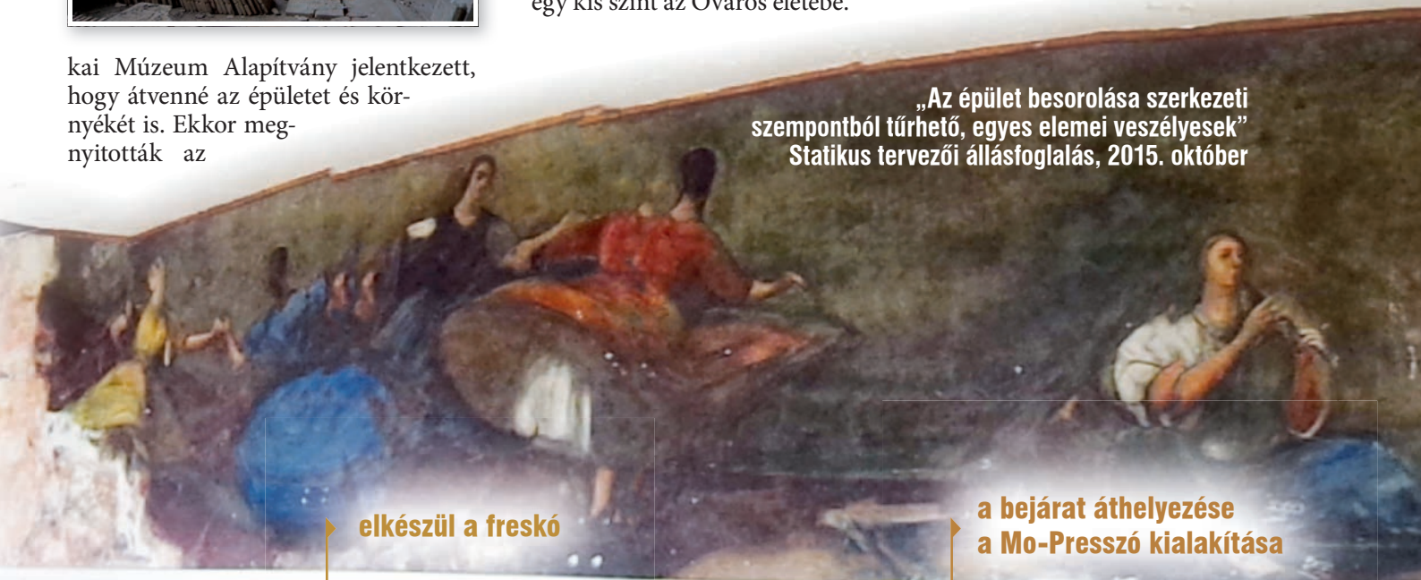
„Az épület besorolása szerkezeti szempontból tűrhető, egyes elemei veszélyesek” Statikus tervezői állásfoglalás, 2015. október