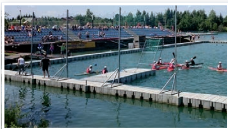
Ilyen ragyogó feltételek mellett készülnek a lengyel kajakpólósok.

Van még idő felkészülni a világbajnokságig. Ezen kívül az a két kulcsjátékos is szerepelhet, akik vizsgáik miatt most nem, remélhetőleg előkelőbb helyen végeznek az országok sorrendjében.