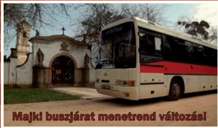
Majki buszjárat menetrend változása!