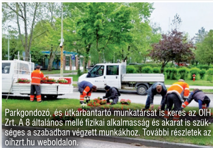
Parkgondozó, és útkarbantartó munkatársat is keres az OIH Zrt. A 8 általános mellé fizikai alkalmasság és akarat is szükséges a szabadban végzett munkákhoz. További részletek az oihzrt.hu weboldalon.