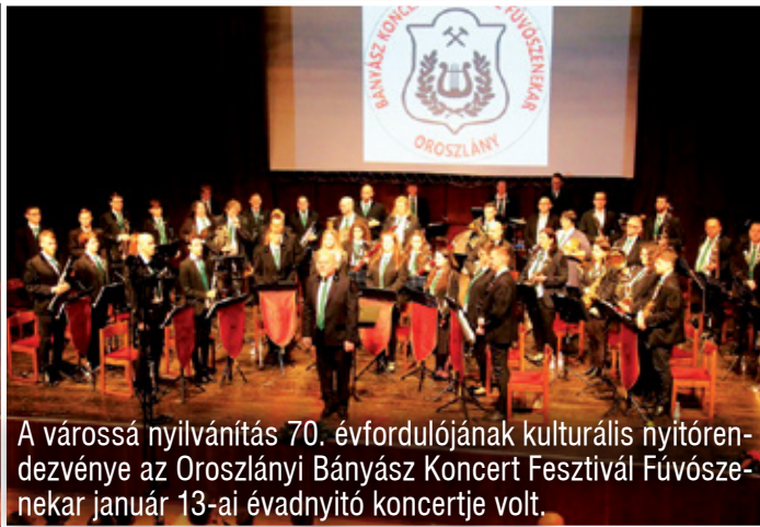
A városná nyilváníás 70. évfordulójának kulturális nyitórendezvénye az Oroszlányi Bányász Koncert Fesztivál Fúvószenekar január 13-ai évadnyitó koncertje volt.