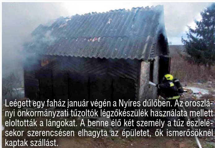
Leégett egy faház január végén a Nyíres dűlőben. Az oroszlányi önkormányzati tűzoltók légzőkészülék használata mellett eloltották a lángokat. A benne élő két személy a tűz észlelésekor szerencsésen elhagyta az épületet, ők ismerősöknél kaptak szállást.